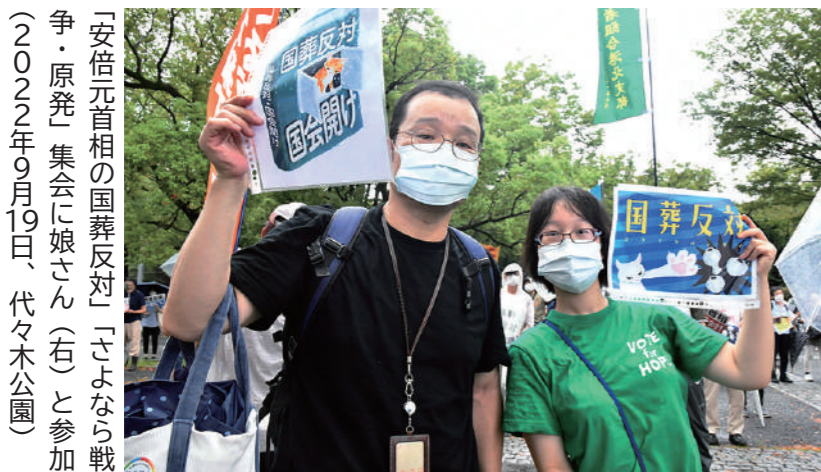
「安倍元首相の国葬反対」「さよなら戦争・原発」集会に娘さん(右)と参加(2022年9月19日、代々木公園)