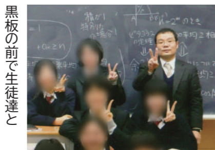
黒板の前で生徒達と 職場の学

●良い教育には働く環境を良くしないと組合結成 他校の先生たちとの交流の中で、良い教育をするには、職場の働く環境を良くしなければならぬと痛感するようになり、有志で労働組合を結成、理事者側が勝手に改ざんした俸給表を元に戻させ、4年分の未払い賃金を払わせたり、産前産後の休暇についても、産前6週間だったのを8週間に改善させたりしました。