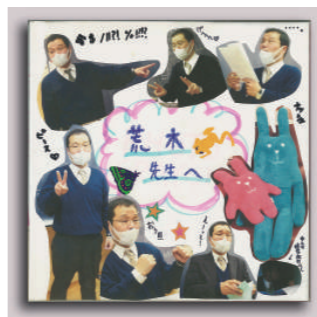
生徒たちが作ったアルバム

切さを学び、生徒の自主性を尊重するよう努めました。生徒の信頼も厚く「クラスの雰囲気」が明るく楽しかった。などの言葉が寄せられていま