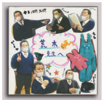
生徒達が作ってくれたアルバム

●良い教育には働く環境を良くしないと組合結成 他校の先生たちとの交流の中で、良い教育をするには、職場の働く環境を良くしなければならぬと痛感するようになり、有志で労働組合を結成、理事者側が勝手に改ざんした俸給表を元に戻させ、4年分の未払い賃金を払わせたり、産前産後の休暇についても、産前6週間だったのを8週間に改善させたりしました。